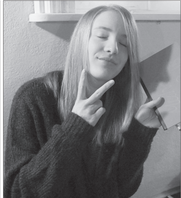
Zeit in der Mühle, 2017, Foto Claudia Weidmann, Quelle privat

Wer einen anderen Menschen fotografiert, tritt in einen Dialog ein. Wie bei einem Gespräch ist es wichtig, den anderen kennenlernen zu wollen und einander mit Respekt zu begegnen.