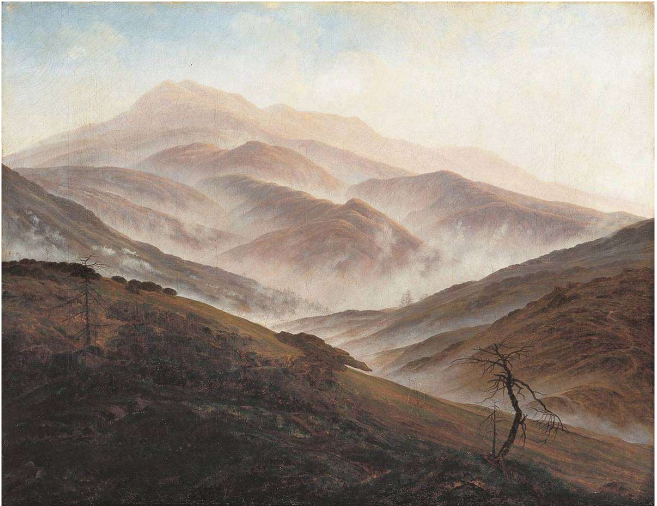
Caspar David Friedrich Riesengebirgslandschaft mit aufsteigendem Nebel um 1890/20 Öl auf Leinwand, 54,9 x 70,4 cm Neue Pinakothek, München

Dieser Blick auf Bergzüge im Riesengebirge entstand wohl, wie alle Werke des Malers, auf der Grundlage von Skizzen und Studien. Die „Sieben Gründe“, dahinter die „Schneeegruben“ werden auch heute noch als der romantische Teil des Riesengebirges in den Wanderführern angepriesen. Es ist eine sehr karge und kahle Landschaft, nur wenige verdorrte Bäume, große Felsbrocken, weite felsige Hügel. Kein Mensch ist zu sehen, vielmehr erscheint die fremdartige Landschaft wie aus einer fernen Zeit – am Beginn der Schöpfung. Der aufsteigende Nebel macht diese Welt noch melancholischer – ein typisches Motiv des Malers, das er auch im bekannten „Wanderer über dem Nebelmeer“ verwendet. Ganz zurückhaltend erscheinen die Farben, das gelbliche Grauweiß und das helle Blau am Himmel ... kleine Hoffnungsschimmer. Charakteristisch ist die Versinnbildlichung vom irdischen Dasein des Menschen – verlassen, bedroht vom Tod – und vom Glauben an Gott – ewige Felsen, die alles überdauern. Es gibt im Gesamtwerk mehrere Versionen dieser Landschaft.