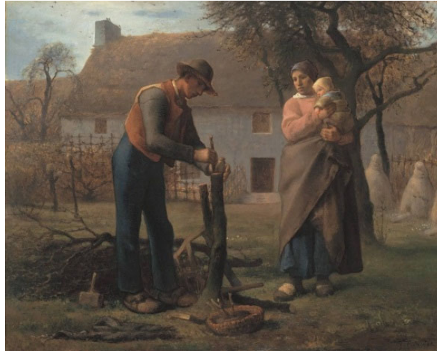
Bauer beim Pfropfen eines Baumes, 1845

Nenne einen Grund, warum Millet zu Recht als Realist gilt.