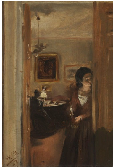
Adolph von Menzel Wohnzimmer mit Menzels Schwester, 1847