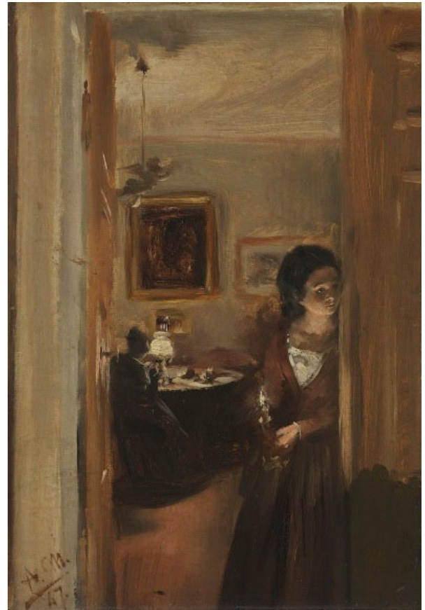
Adolph von Menzel Wohnzimmer mit Menzels Schwester, 1847, Neue Pinakothek, München