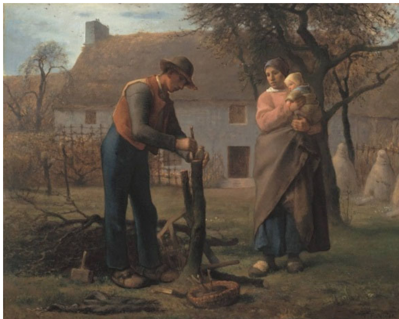
Jean-Francois Millet, Bauer beim Pfropfen eines Baumes, 1845 Neue Pinakothek, München